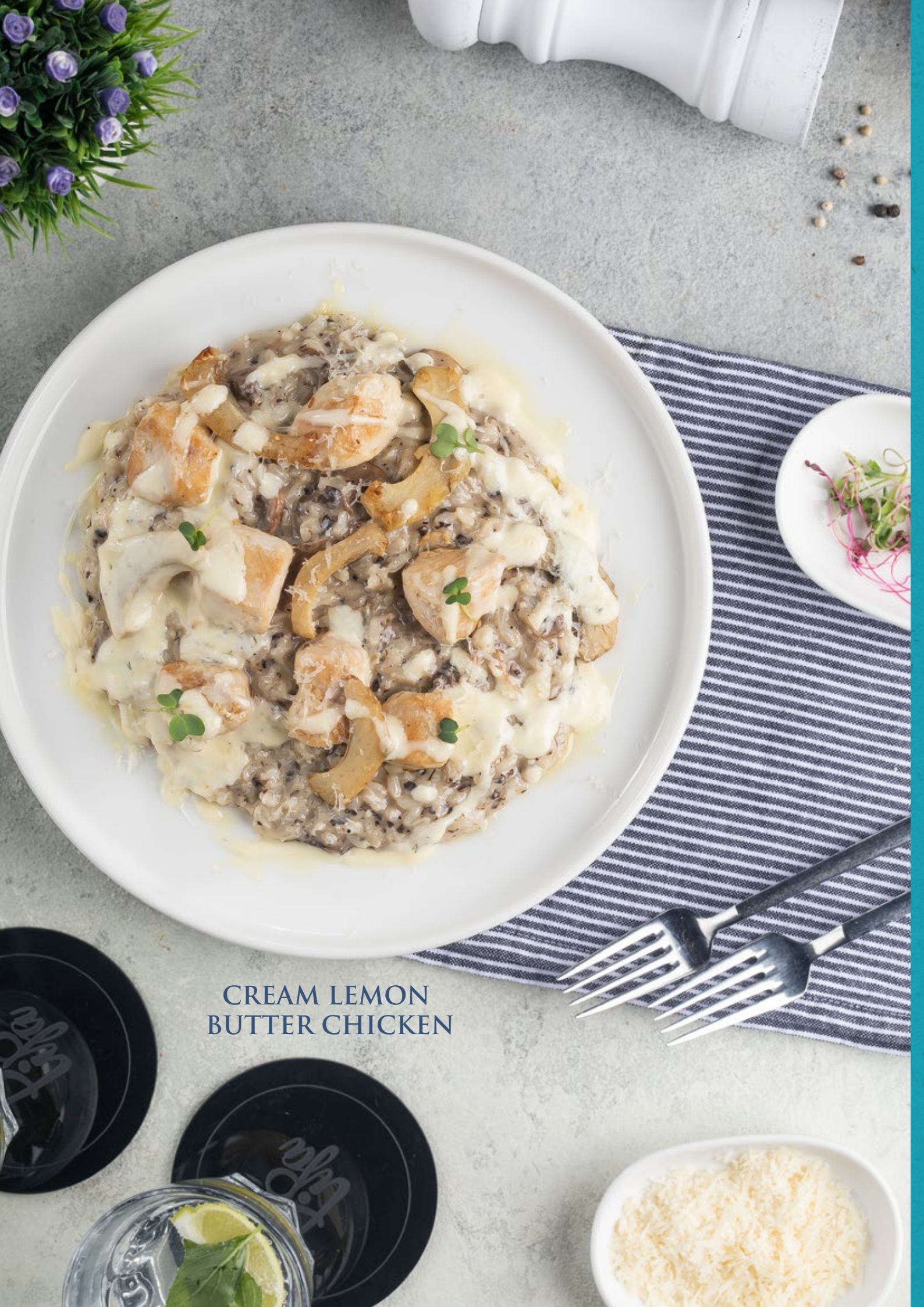
CREAM LEMON BUTTER CHICKEN