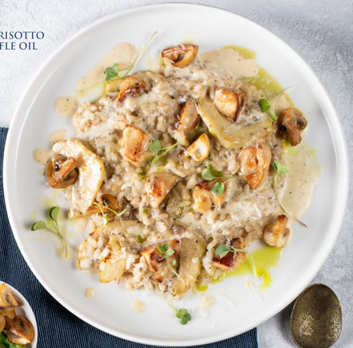
MUSHROOM RISOTTO WITH TRUFFLE OIL