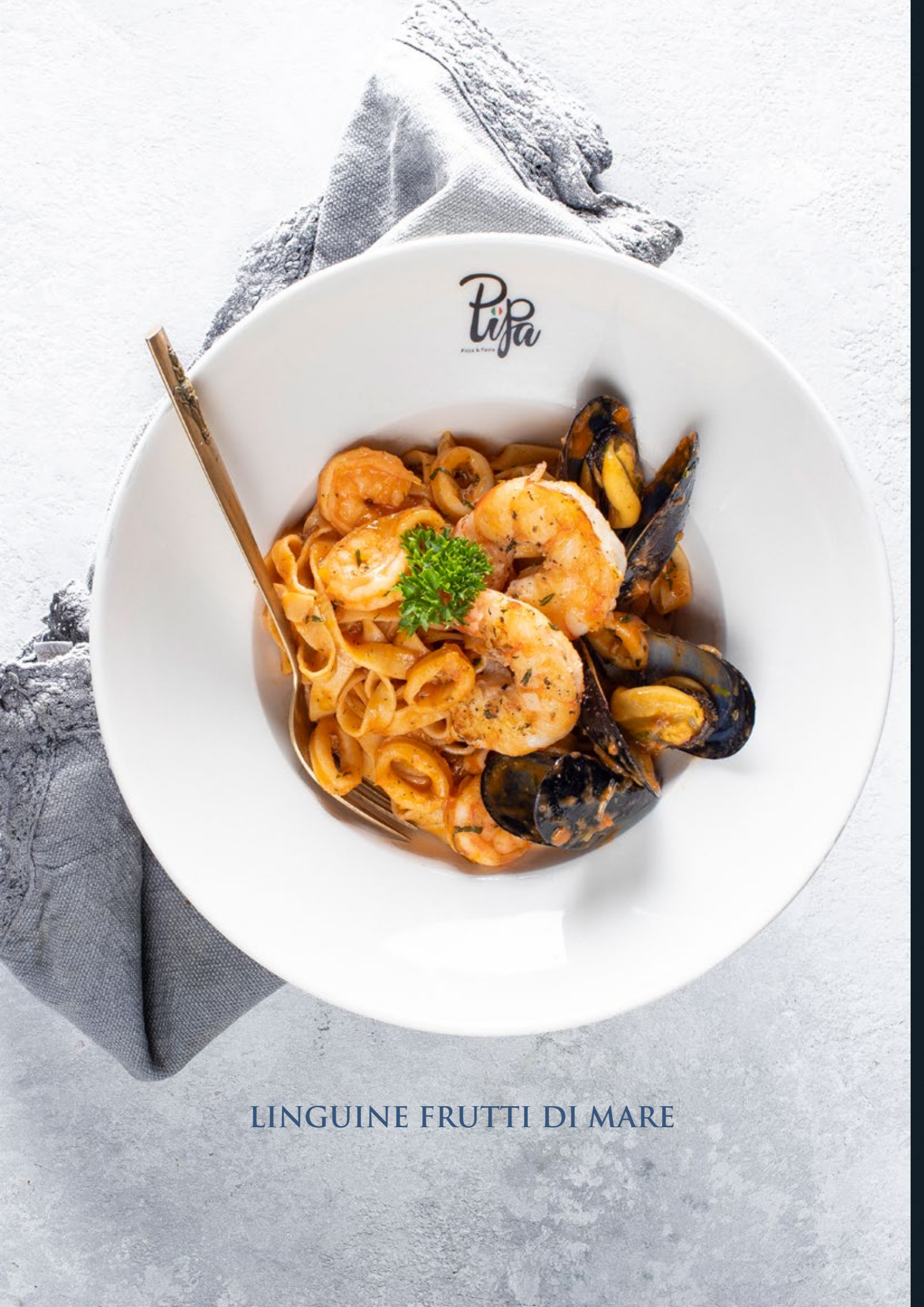
LINGUINE FRUTTI DI MARE